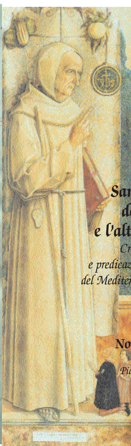
Linea Grafica • 0735 702910